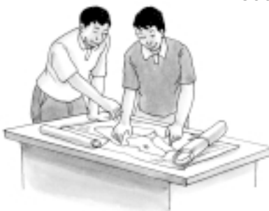
Los Comités de Gestión de Obra