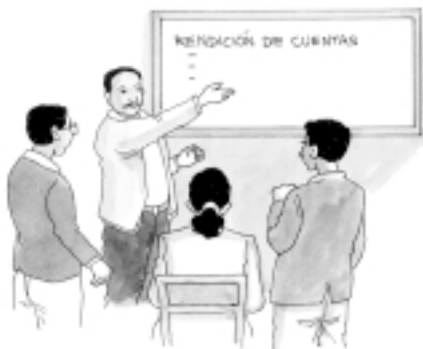
Alcalde, regidores, funcionarios y trabajadores.