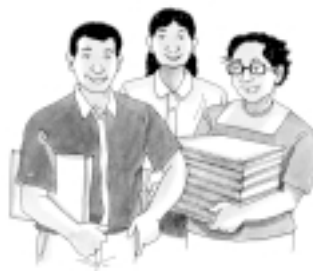
Los Consejos de Coordinación Local